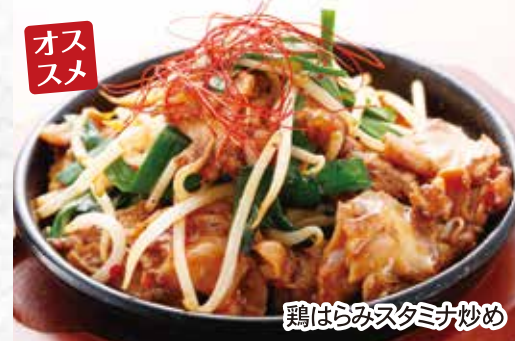
鶏はらみスタミナ炒め