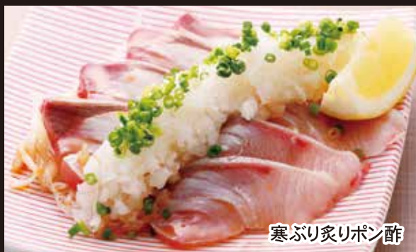
寒ぶり炙りポン酢