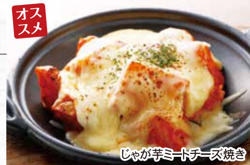
じゃが芋ミートチーズ焼き