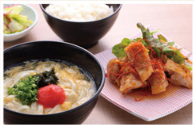
油淋鶏&明太餡かけうどん (ごはん・小鉢付) ¥850