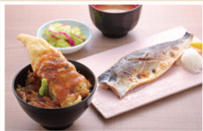
サバ塩焼き&穴子飯 (みそ汁・小鉢付) ¥900