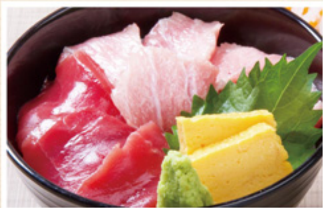
本鮭鉄火丼 (みそ汁・小鉢付) ¥1,500