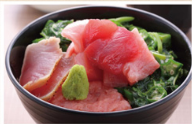
鮭ねばねば丼 (みそ汁・小鉢付) オクラ・モロヘイヤ ¥900