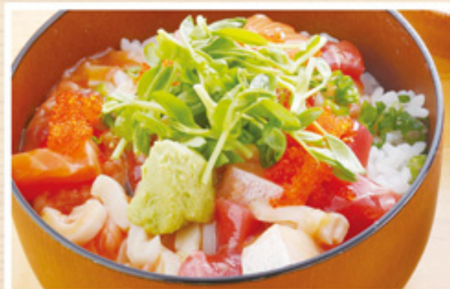
愛媛の郷土料理 魚介たっぷりひゅうが飯 (みそ汁・小鉢付) ¥850