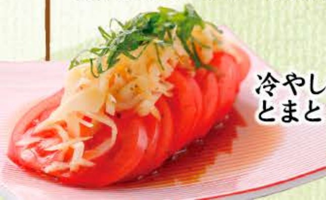
冷やしガリ とまと 480円