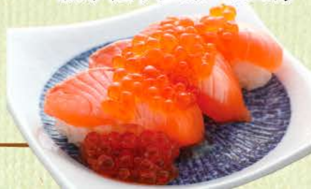
あぶりサーモン 親子握り(3貫) 750円