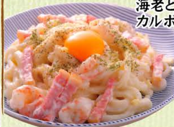
海老とベーコンの カルボウどん 850円