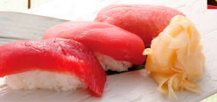
赤身、中とろ、大とろの3種類が味わえます 生本鮪3貫盛り 850円