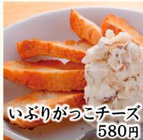
いぶりがっこチーズ 580円