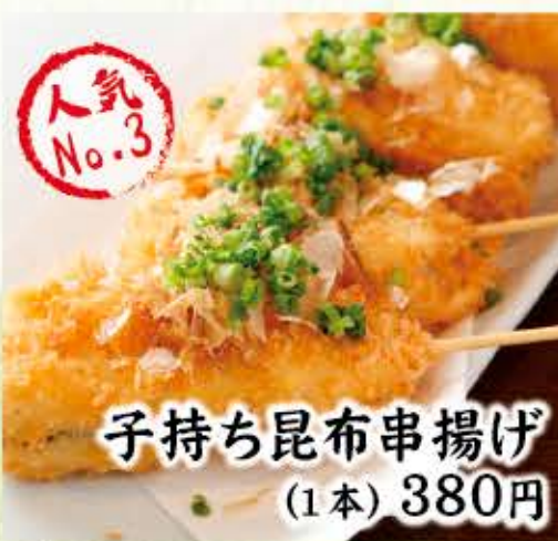
子持ち昆布串揚げ (1本) 380円