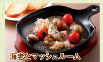
海老とマッシュルーム