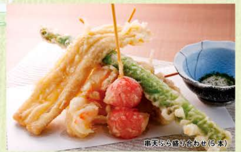
串天ぷら盛り合わせ(5本)

たまねぎ 210円 プチトマト 210円 えび 240円 煮あなご 270円 とり天 240円 アスパラ 270円