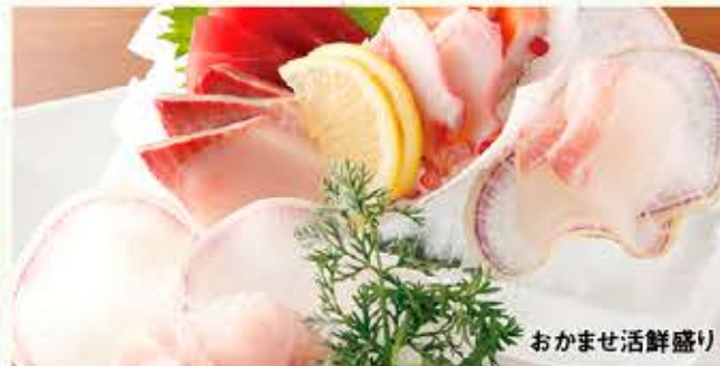
おかませ活鮮盛り