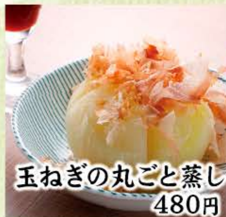
玉ねぎの丸ごと蒸し 480円