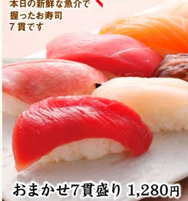
おまかせ7貫盛り 1,280円