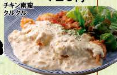
チキン南蛮 タルタル